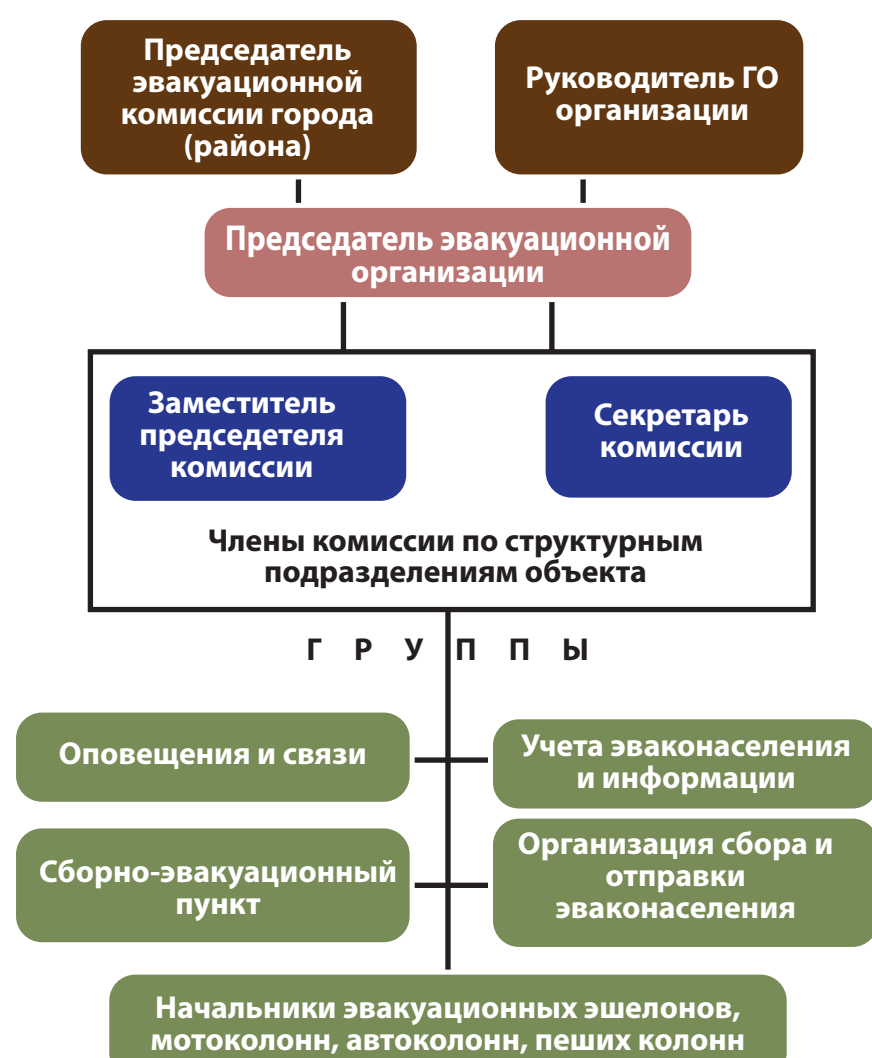
СХЕМА ОРГАНИЗАЦИИ СБОРНОГО ЭВАКУАЦИОННОГО ПУНКТА